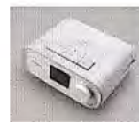
当院で処方している機械