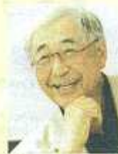
渡辺淳一 氏(作家、「鈍感力」「失楽園」ほか著書多数)